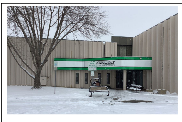
空港の訓練所の入り口です。日本の雪国のような積雪量はありませんが、うっすらと積もります。

保護者並びに関係者のみなさまには本年もご理解とご支援を賜り感謝申し上げます。みなさまのおかげで事故や大きな事件もなく過ごすことができました。また、訓練再開後、1 年半以上をかけて通常の訓練体制に戻りました。みなさま 良い年をお迎えください。