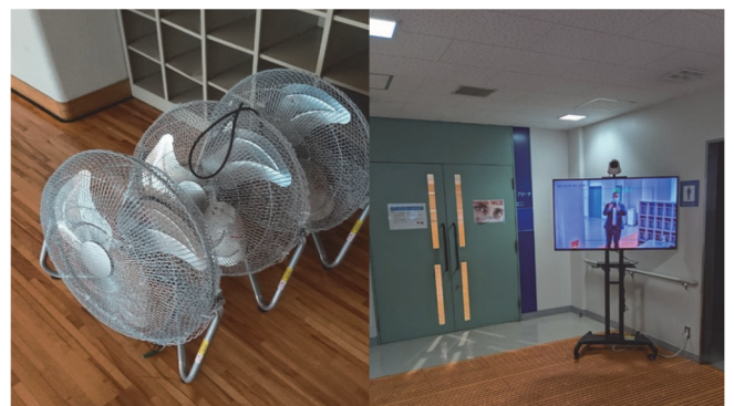
Fig.1 Infection Prevention with Fan and Thermal Camera

場の換気、4) 授業前の検温、5) 各教場の最大収容人数の設定、最後に、6) 対面授業で扱う実技の種目選択、以上6点について遵守する事を周知徹底した。具体的には、1) 運動中のマスク着用は非常に息苦しく、学生に着用を義務付けるのは心苦しかったが、授業中の着用は徹底し、短めの休憩時間を多用した。例外としてマスクを外す必要がある場合は、窓際、或いは廊下に出るなど周囲に人がいない状況のみ可とした。2) 手指及び教具の消毒は、屋内の教場及び更衣室の出入口に消毒液を設置し、教員は常に消毒液と除菌シートを携行した。授業開始及び授業内の小休憩後は手指消毒から始めた。また、授業前後は全ての教具を消毒した。3) 教場の空気を循環させるために設置型扇風機を用いた。アリーナでは窓を開け、扇風機を四隅に設置し、積極的に外気をアリーナ内に入れるようにした。地下2階のフィットネスルームは、廊下側の窓を全て開け、扇風機を出入口2ヶ所に設置し空気が滞留しないようにした。また、男子更衣室の入口にも扇風機を設置し、換気に努めた（Fig.1 参照）。4) 高輪校舎入構時にサーマルカメラで検温はしているが、授業時は入構より時間が経過している場合もある事を鑑み、出欠を取る際に再び検温を行った。アリーナとフィットネスルームは入口のサーマルカメラにて、テニスコートは非接触型温度計（ガンタイプ）にて検温し、出欠カードに検温結果を記録するようにした（Fig.1 参照）。5) 各教場の最大収容人数を履修最大学生数と設定し、アリーナを20名、フィットネスルーム及びテニスコートを15名とした。6) 最後に対面授業の実施種目は、比較的履修者同士の接触が少ない下記の5種目とし、（卓球、バドミントン、ゴルフ、テニス、ボッチャ）その中から担当教員が担当種目を選択し行った。